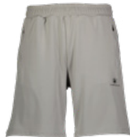
LUMBERJACK Şort - Shorts