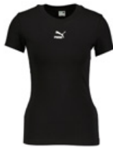
PUMA Tişört - T-Shirt