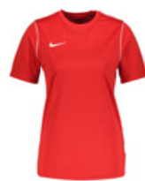
NIKE Tişört - T-Shirt