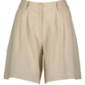
SHEFAME Şort / Shorts