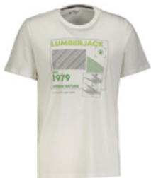
LUMBERJACK Tişört - T-Shirt