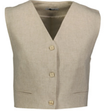
SHEFAME Yelek / West