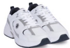
LUMBERJACK Ayakkabı - Shoes