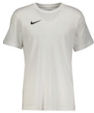
NIKE Tişört - T-Shirt