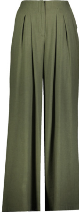
SHEFAME Pantolon / Pants