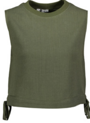
SHEFAME Bluz / Blouse

Shefame yeni koleksiyonuyla palazzo pantolonlardan klasik yeleklere birçok özel tasarımı birlikte sunuyor. Öne çıkan detaylar arasında ise klasik giyimin anahtar parçalarının özel kumaşlarla buluşması yer alıyor. Pamuk ve keten kumaşlardan tasarlanan tonsürton kıyafetler, ferah bir yaz etkisi yaratıyor. Her tasarımında şıklığı vurgulayan Shefame, özellikle ofis giyiminde tercih edilen klasik tasarımları, kendi stil kodlarıyla yorumluyor. Koleksiyonun öne çıkan tasarımlarında kum beji ve haki yeşili gibi pastel renklere oluşan ikili takımlar yer alıyor. Mevsimin vazgeçilmezi olacak şortlu yelek kombini ise çabası şıklığı özetliyor. Konforlu ve şık kombinler için Shefame tasarımlarını keşfedin.